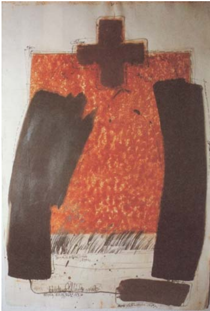
Herbert Schäfer: "Rostfläche mit Teerbügeln", Rost, Teer auf Blüten