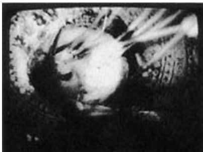
Ulrike Rosenbach: "Reflektionen über die Geburt der Venus", 1976/78