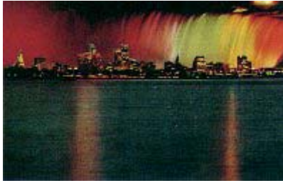
Peter Weibel: "Gesänge des Pluriversums", 1986

Dieses Video ist vor allem eine Plastik. Jedoch nicht in den klassischen Materialien und Substanzen wie Marmor, Holz und Fett, sondern im relativ substanzlosen, immateriellen elektronischen Medium. Als solche artikuliert sie nicht den vergangenen Raum klassischer Vorstellungen mit seinen konstanten Größen, sondern die künftige relativistische elektronische Raumzeit. Anders als bei den Skulpturen aus Holz und Eisen, wo Raum und Zeit gefroren sind, wo die räumlichen und zeitlichen Beziehungen unveränderliche Größen bleiben, sind in elektronischen Skulpturen die räumlichen und zeitlichen Beziehungen veränderbar, da in ihnen nicht nur die Bilder, sondern auch die Bildinhalte selbst beweglich sind, und zwar vollkommen unabhängig voneinander.