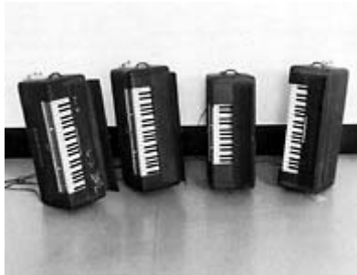
Paul Panhuysen: "Requiem for an Unknown Soldier" 1988.

Diese Installation besteht aus vier tragbaren Orgeln, die für Feldmessen der französischen Armee während des Zweiten Weltkrieges gemacht wurden. Drei der Orgeln spielen je vier verschiedene Töne gleichzeitig mit kurzen Pausen, die vierte Orgel spielt gleichzeitig und ständig vier Töne. Sie sind nach folgender Formel gestimmt: Orgel I: entsprechend der Tastatur — Töne 1—8—15—22; Orgel II: Töne 3—11—19—27; Orgel III: Töne 5—14—23—31; Orgel IV: Töne 7—17—27—37.