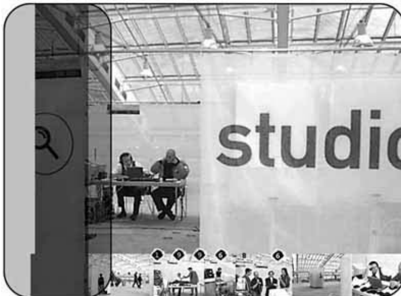
TNC's Webstudio at Ars Electronica 96