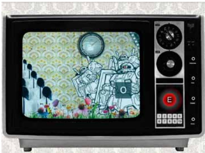
Auszeichnung 2009, Sound Machines , HLW des Schulvereins der Kreuzschwestern

Wenn ihr in einem Team gearbeitet habt, dann legt eurer Einreichung eine Liste mit Name, Adresse, Geburtsdatum und Konfektionsgröße ALLER Team-Mitglieder bei! Nur so können wir sicherstellen, dass jedem/r ein u19-T-Shirt zugesandt wird.