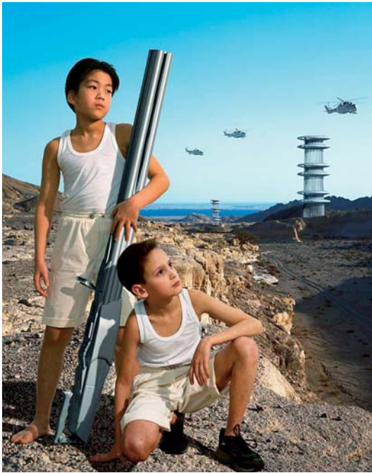
Action Half Life Episode 2 #14