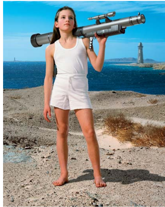
Action Half Life Episode 2 #16