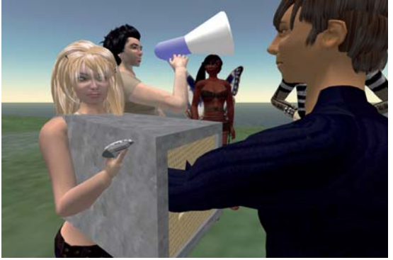
Reenactment of Valie Export's Tapp und Tastkino -Synthetic Performance in Second Life , 2007