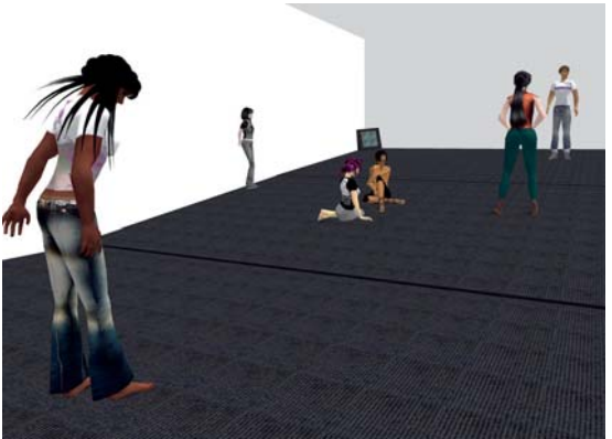
Reenactment of Vito Acconci's Seedbed -Synthetic Performance in Second Life , 2007