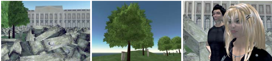
Reenactment of Joseph Beuys' 7000 Oaks -Synthetic Performance in Second Life , 2007

http://0100101110101101.org/projects.html