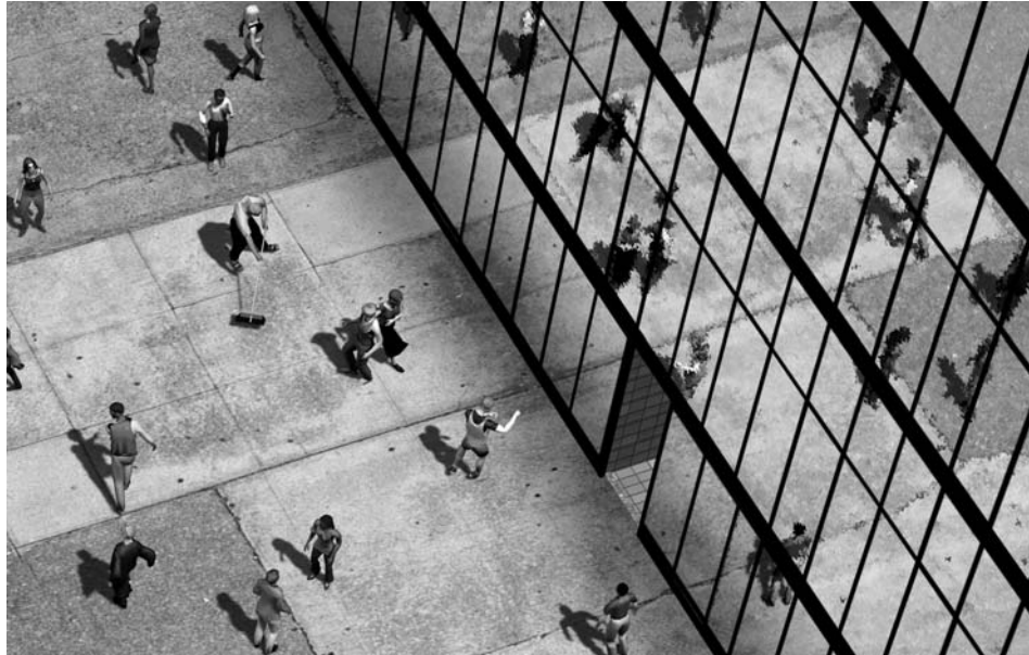
Pedestrian still frames